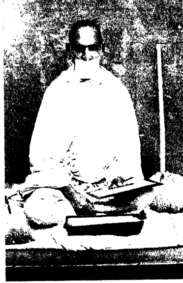
श्री श्री श्री १९०८ श्री श्री १९०८ श्री १९०८ श्री १९०८ ( निवृत्त परिचय के लिये है पूजन के लिये नहीं )

धन्यवाद करता हूँ, जो महान् पवित्र शास्त्रोद्धार में हमें निरन्तर महायता दे रहे हैं। ३२ शास्त्रों के अनुवाद का बड़ा भारी बोझ उठाना यह उन्हीं की वन्नमयी लेखिनी का काम है। उन्होंने मुझे इस काम में पूरी तरह से महायता देने की कृपा की है। किसी भाग में भी त्रुटि नहीं रखी। जिस शीघ्रता और निपुणता से शास्त्रों के अनुवाद का कार्य चल रहा है, उसे समझने वाले ही समझते हैं। आप हमारी पंजाबी सम्प्रदाय की माधु समाज में विशेष प्रतिष्ठित हैं। बाल-ब्रह्मचारी और प्रसिद्ध शास्त्रमर्मज्ञ हैं, उपाध्याय आदि उपाधियों से विभूषित और अपनी क्रिया में परम प्रवीण हैं। हमारी प्रभु से यही प्रार्थना है कि आप चिरायु हों, जिससे कि यह पुनीत कार्य सफलतापूर्वक चलता रहे।